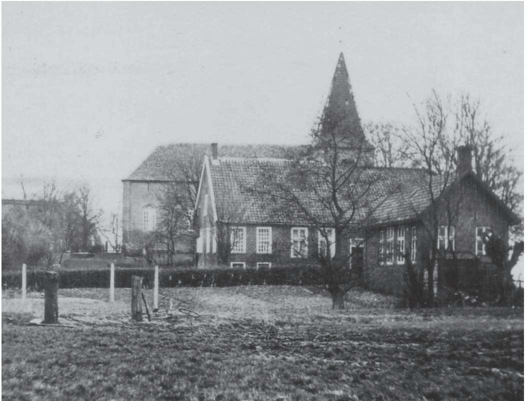
Das Lehrerhaus in Grotgaste zwischen dem kleinen Schulgebäude und der Kirche, vorne links ist die „Bleiche“ gut zu erkennen