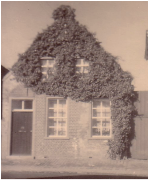
Ingrid Basses Geburtshaus in Hage, Ostfriesland